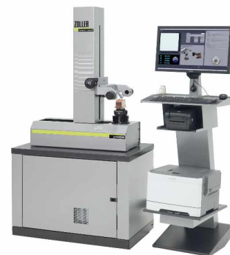
Zoller Voreinstellgerät „ smile – EDM “

Email: zentrale@owm-vertrieb.de • Internet: www.owm-vertrieb.de